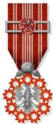
Insígnia Autonomica de Mérito Cívico - Peito

Destinada a agraciar aqueles que, em resultado de uma compreensão nítida dos deveres cívicos, contribuíram, de modo relevante, para os serviços à comunidade, nomeadamente nas áreas de ação social e cultural.