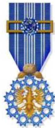
Insígnia Autonomómica de Valor - Peito