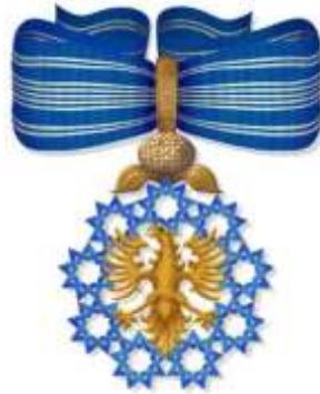
Insígnia Autonomómica de Valor - Pescoço