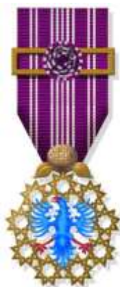
Insígnia Autonomica de Reconhecimento - Peito