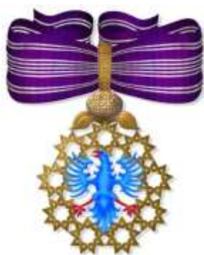
Insígnia Autonomica de Reconhecimento - Pescoço