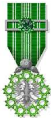
Insígnia Autônômica de Mérito Industrial, Comercial e Agrícola - Peito

Destinada a agraciar aqueles que, tendo desenvolvido a sua atuação nas áreas industrial, comercial ou agrícola, se hajam destacado por relevantes serviços para o seu desenvolvimento ou por excepcionais méritos na sua atuação;