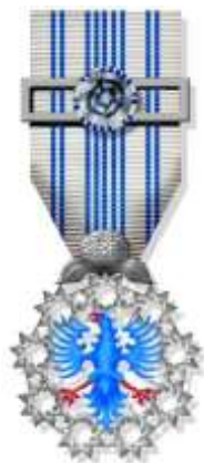
Insígnia Autonomica de Dedicacão - Peito

A Insígnia Autonomica de Dedicacão visa destacar relevantes serviços prestados no desempenho de funçōes na Administraçāo Pùblica, bem como agraciar aqueles funcionários que demonstrem invulgares qualidades dentro da sua carreira e que, pelo seu comportamento, possam ser apontados como exemplo a seguir.