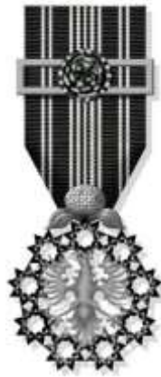
Insígnia Autonomónica de Mérito Profissional - Peito

Destinada a agraciar o desempenho destacado em qualquer atividade profissional, quer por conta própria, quer por conta de outrem;