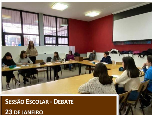
SESSÃO ESCOLAR - DEBATE 23 DE JANEIRO

A Sessão Escolar decorreu, na ESAQ, no dia 23 de janeiro, na sala de Convívio da Secção. Contou com a presença da única lista concorrente do Ensino Básico, formada por alunos do 8.º ano, para darem o seu contributo