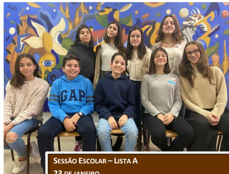
SESSÃO ESCOLAR – LISTA A 23 DE JANEIRO

Terminada a Sessão Escolar, com os cargos dos nossos jovens deputados definidos, a ESAQ pode finalmente estar a caminho de uma boa representação do Básico na Sessão Regional. Como não poderia deixar de acontecer a aluna Jornalista estará sempre atenta ao desenrolar dos acontecimentos e com a lente a postos para captar novos momentos.